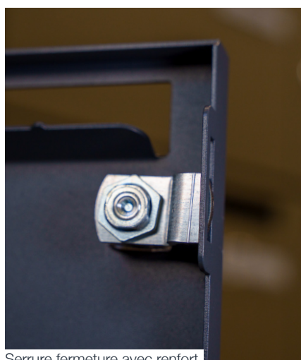
Serrure fermeture avec renfort